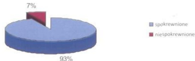
Wykres 1. Struktura rodzin zastępczych według pokrewieństwa w 2007 roku

Zgodnie z zapisami ustawy o pomocy społecznej jednym z zadań przypisanych do realizacji powiatom jest pomoc dziecku i rodzinie. Dzieciom pozbawionym częściowo lub całkowicie opieki rodzicielskiej Miejski Ośrodek Pomocy Społecznej zapewnia opiekę i wychowanie w rodzinach zastępczych spokrewnionych z dzieckiem lub niespokrewnionych oraz w placówkach opiekuńczo - wychowawczych.